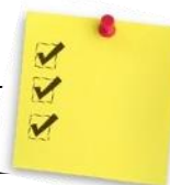
TABLEAU SYNTHÈSE FRAIS DU SERVICE DE GARDE